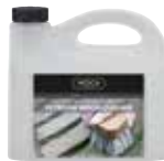
CLEANER-WOCA-01 Nettoyant Woca 2,5 l