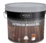
OIL-WOCA-011 Huile Woca couleur teak 2,5 l